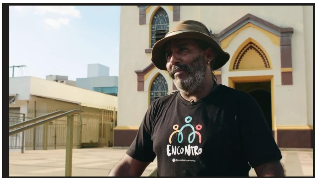
Figura 13: Frame do Filme Institucional – Projeto Encontro – Fase I