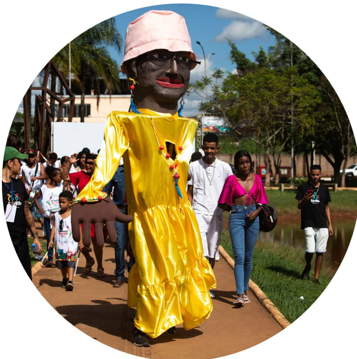
Figura 8: Projeto ENCONTRO na cidade de Barão de Cocais