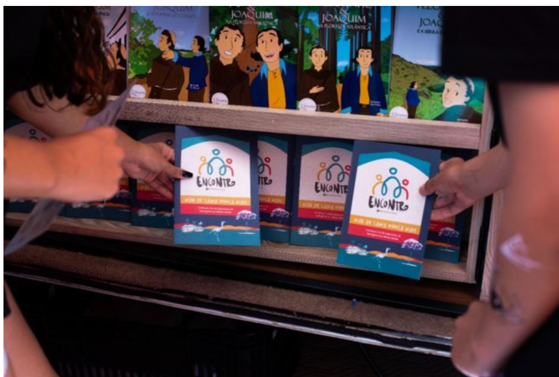
Figura 12: Projeto ENCONTRO – Divulgação da Lei Mar de Lama Nunca Mais