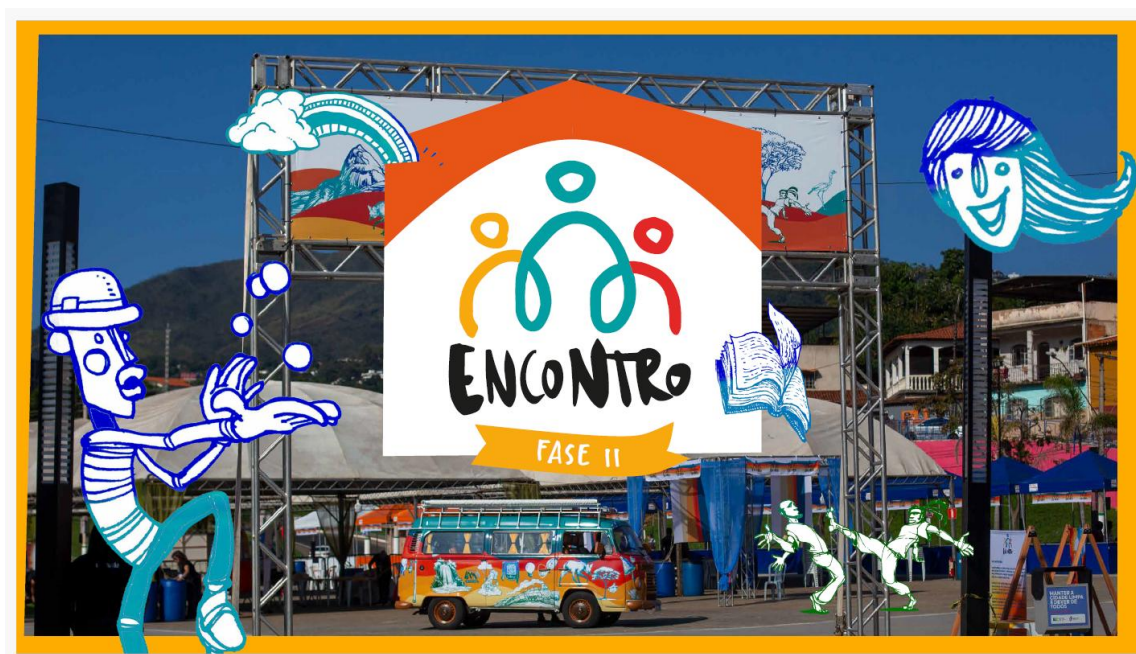
Figura 13: Apresentação do Plano de Atividades – Projeto Encontro – Fase II