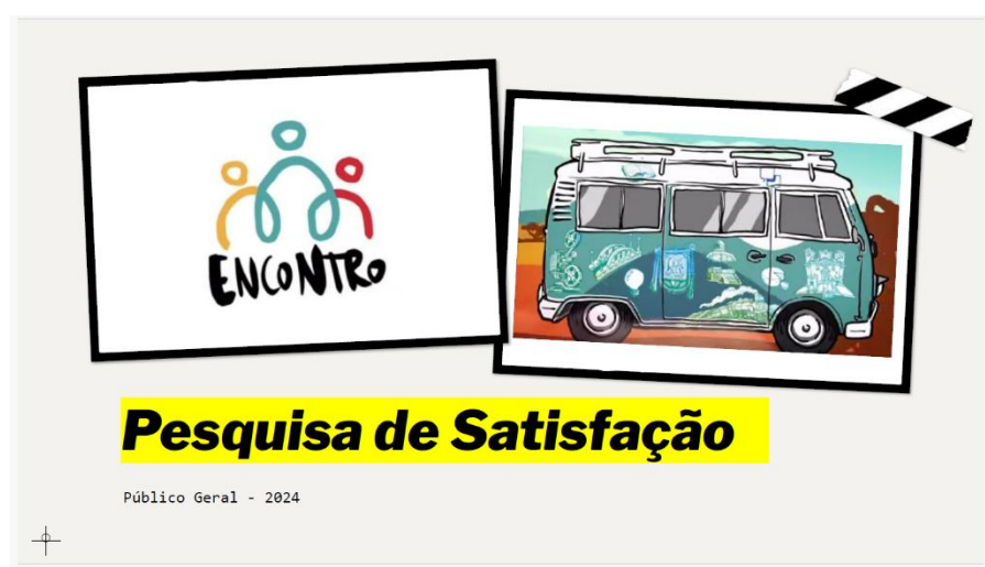
Figura 14: Apresentação da Pesquisa de Opinião – Projeto Encontro – Fase I