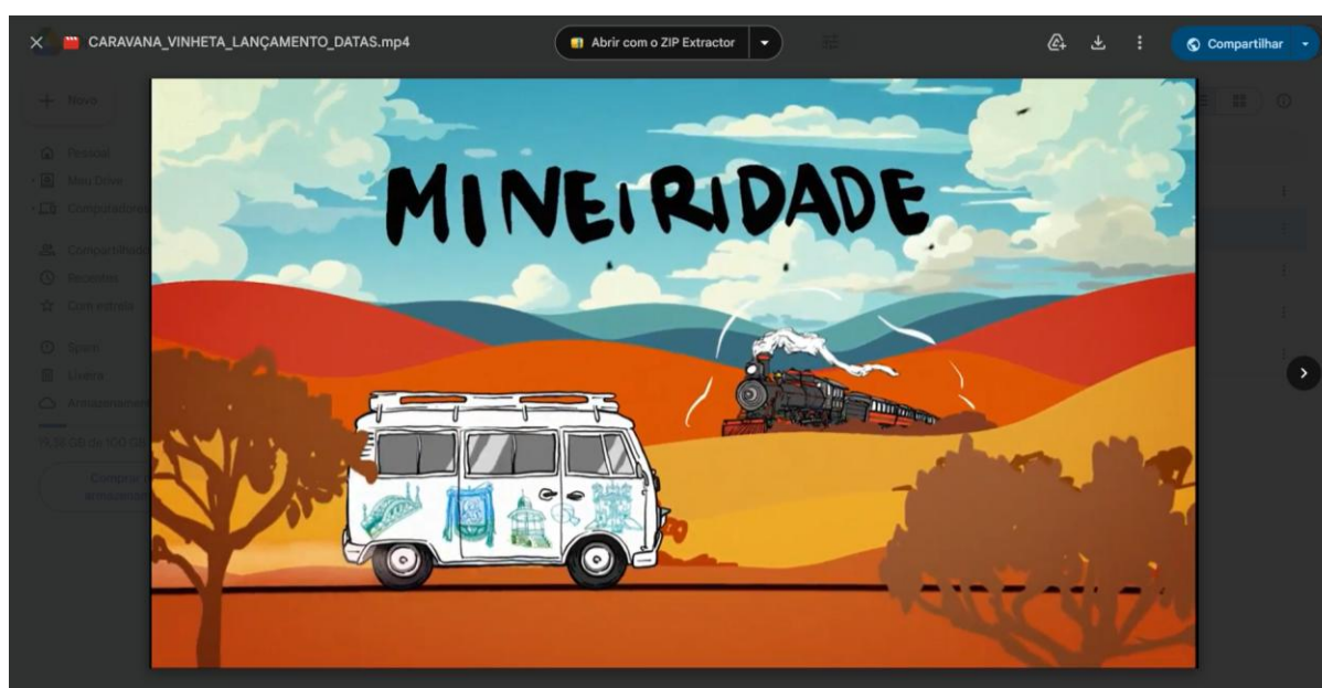
Figura 5: Frame da Vinheta do Projeto Encontro – Fase I