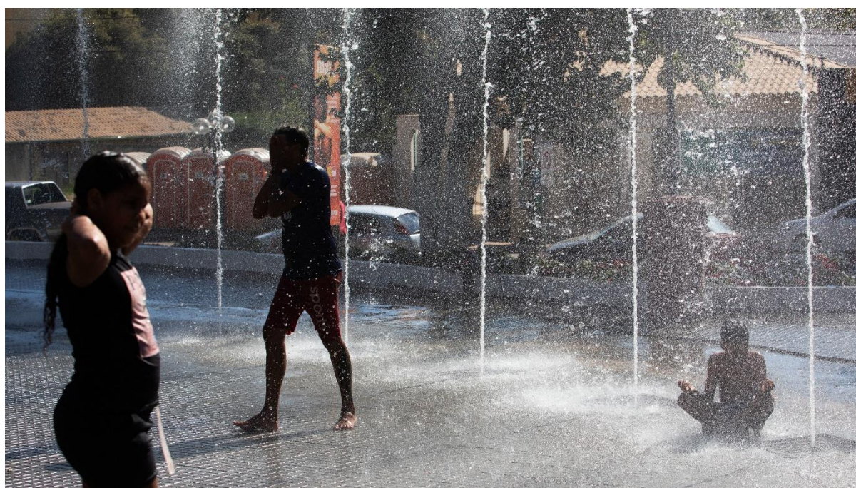
Figura 10: Projeto ENCONTRO na cidade de Itatiaiuçu