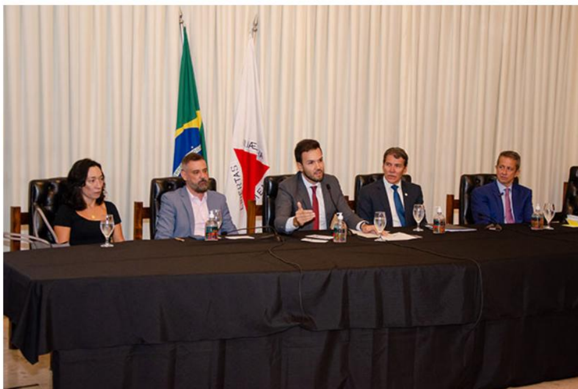
Figura 3: Composição de mesa de autoridades - Apresentação do Projeto Encontro - Fase I - ALMG