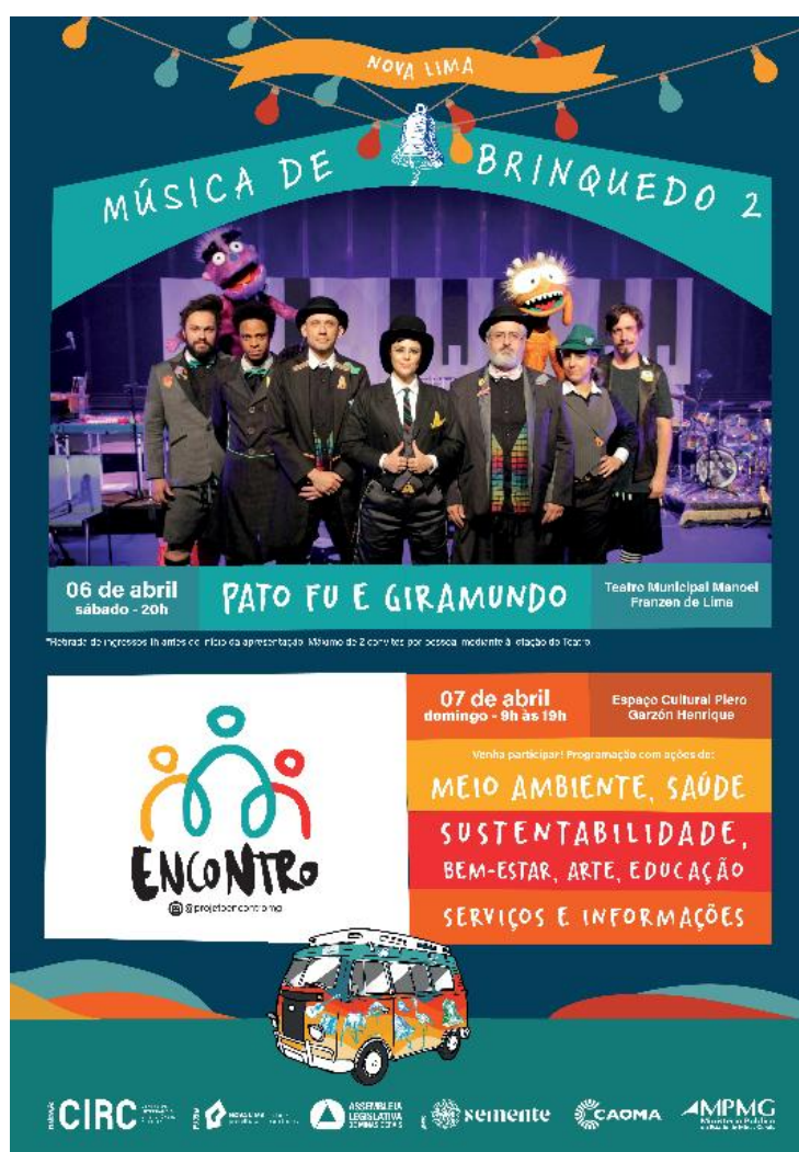
Figura 6: Convite de lançamento Projeto ENCONTRO na cidade de Nova Lima