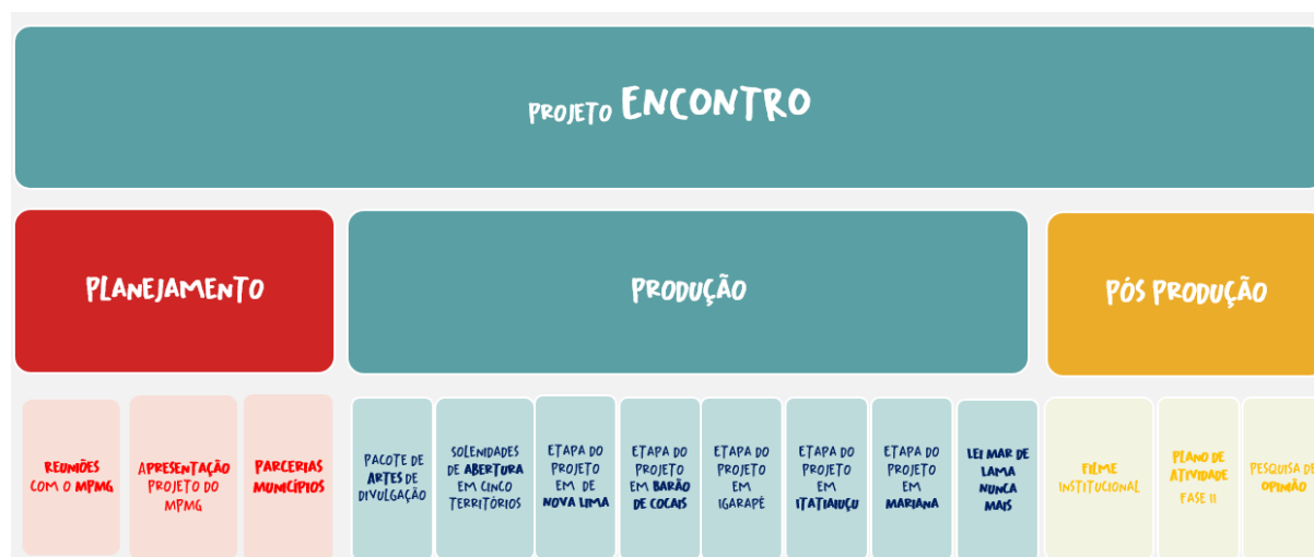
Figura 1: Plano de Monitoramento do Projeto ENCONTRO - Atividades x Metas

Conforme Plano de Monitoramento e Cronograma elaborado no projeto, foram estabelecidas 14 atividades e metas correlacionadas, vide Figura 01 , pelas diversas etapas do seu desenvolvimento e envolvendo as cinco cidades mineiras - Nova Lima, Barão de Cocais, Igarapé, Itatiaiuçu e Mariana, contempladas na circulação da Caravana, entre os meses de abril e maio de 2024.