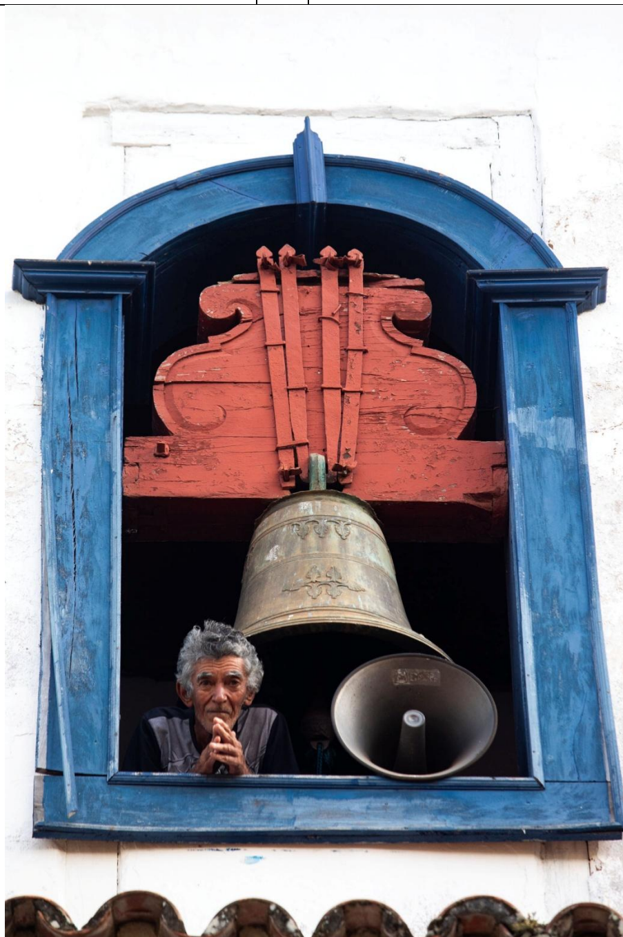
Figura 11: Projeto ENCONTRO na cidade de Mariana