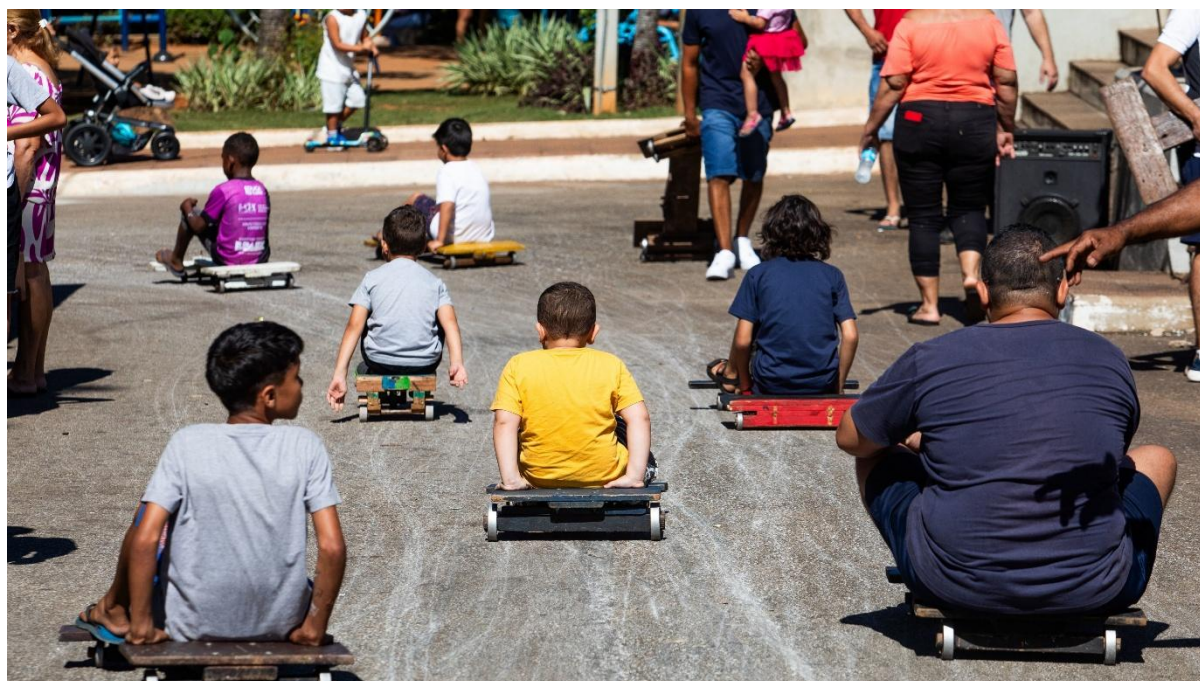
Figura 9: Projeto ENCONTRO na cidade de Igarapé