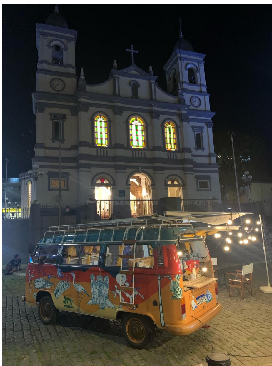
Figura 7: Projeto ENCONTRO na cidade de Nova Lima